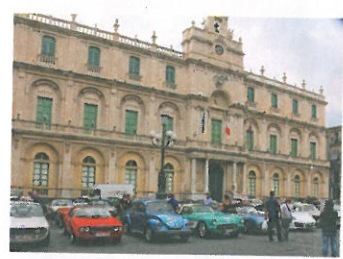
Wagenparade vor dem Rathaus im sizilianischen Catania.